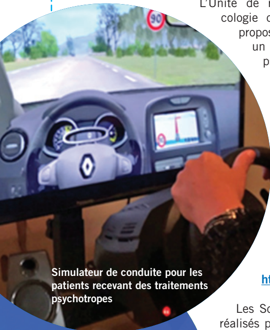
Simulateur de conduite pour les patients recevant des traitements psychotropes