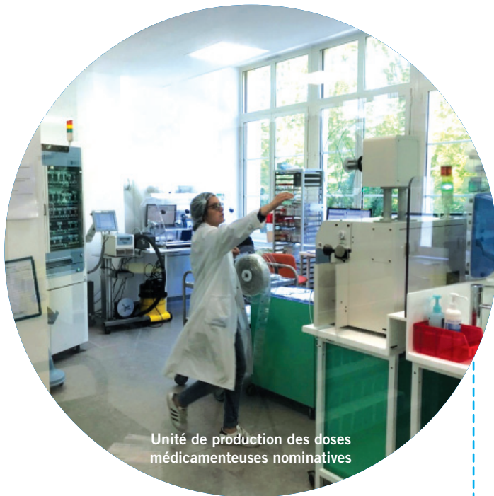
Unité de production des doses médicamenteuses nominatives

Le contrôle optique industriel automatisé est désormais systématique pour toutes les doses médicamenteuses nominatives préparées par l'unité de production de la PUI du CH Pierre LÔO. Cette action entre dans le cadre de la sécurisation du circuit du médicament, de la lutte contre la iatrogénie et de la traçabilité des doses produites pour les unités de soins du CH Pierre LÔO réparties sur le département de la Nièvre et du Cher.