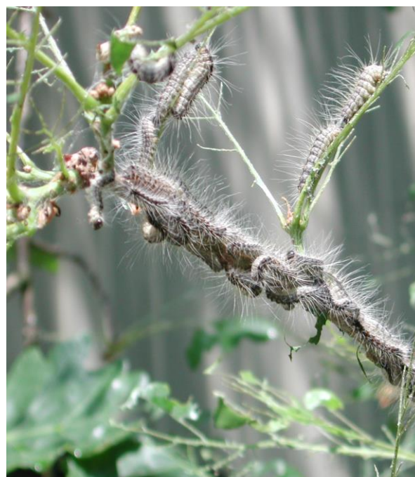
Chenilles processionnaires du chêne ( Thaumetopoea processionea )