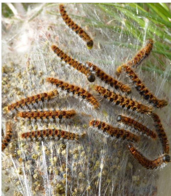
Chenilles processionnaires du pin ( Thaumetopoea pityocampa )