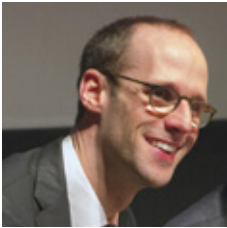
Pierre Pribile, directeur général de l'ARS Bourgogne- Franche-Comté

Le volet investissement du Ségur de la santé constitue une opportunité historique pour notre région, par l'ampleur sans précédent des aides à l'investissement allouées, mais aussi par le changement de méthode dans l'allocation de ces fonds, déconcentrée au niveau régional.