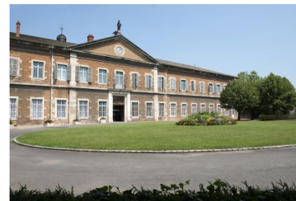
Site de l'Hôtel Dieu