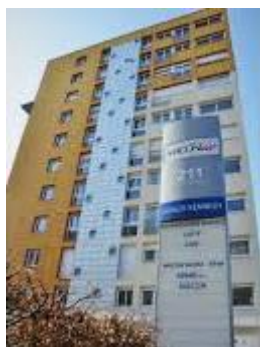
Centre de santé mentale de Mâcon