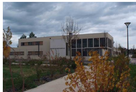
Centre de santé mentale de Paray-le-Monial